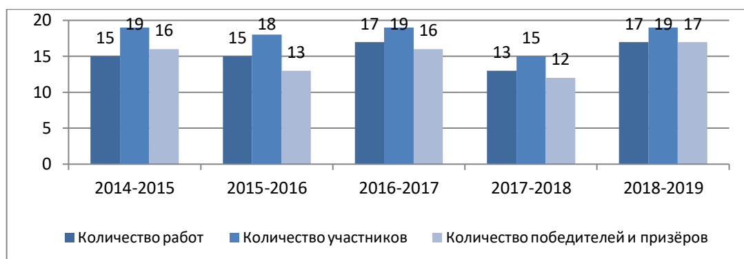
Рис.14. Диагностика активности и результативности участия учащихся ОУ района в Конкурсе творческих проектов «Гармония» за 2014-2019 годы

В конкурсе социальных проектов учащихся «Со-Действие» в истекшем году приняли участие 5 команд: МКОУ СОШ № 2 г. Майского, МКОУ «СОШ №3 с углубленным изучением отдельных предметов г. Майского», МКОУ СОШ № 5 г. Майского, МКОУ СОШ № 8 ст. Котляревской, МКОУ ООШ №10 г. Майского. Результаты участия: I место – МКОУ СОШ №5 г. Майского; II место – МКОУ «СОШ №3 с углубленным изучением отдельных предметов г. Майского»; III место - МКОУ СОШ № 8 ст. Котляревской.