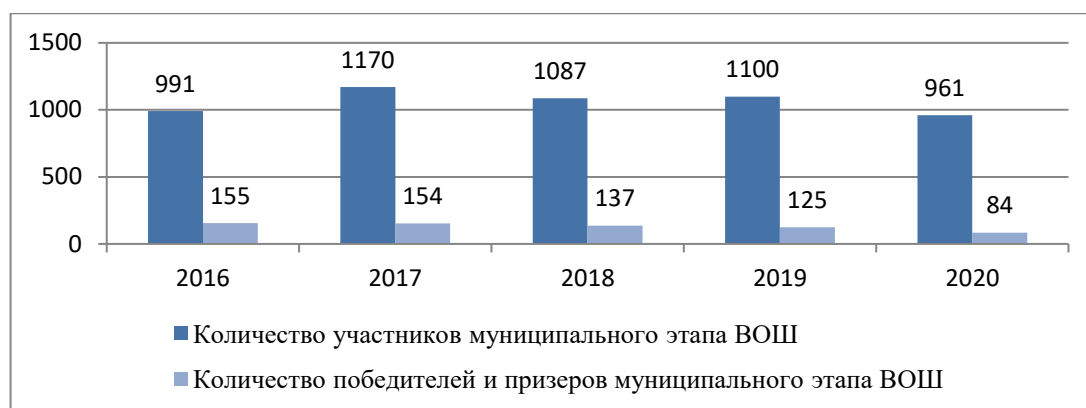
Рис. 2. Активность и результативность участия учащихся ОУ в муниципальном этапе ВсОШ за период 2016-2020 годы, чел.

Наибольшее количество участников ВсОШ наблюдалось по следующим предметам: физическая культура (94 участника), биология (88 участников), география (82 участника), русский язык (74 участника), обществознание (69 участников), история (66 участников), математика (65 участников).